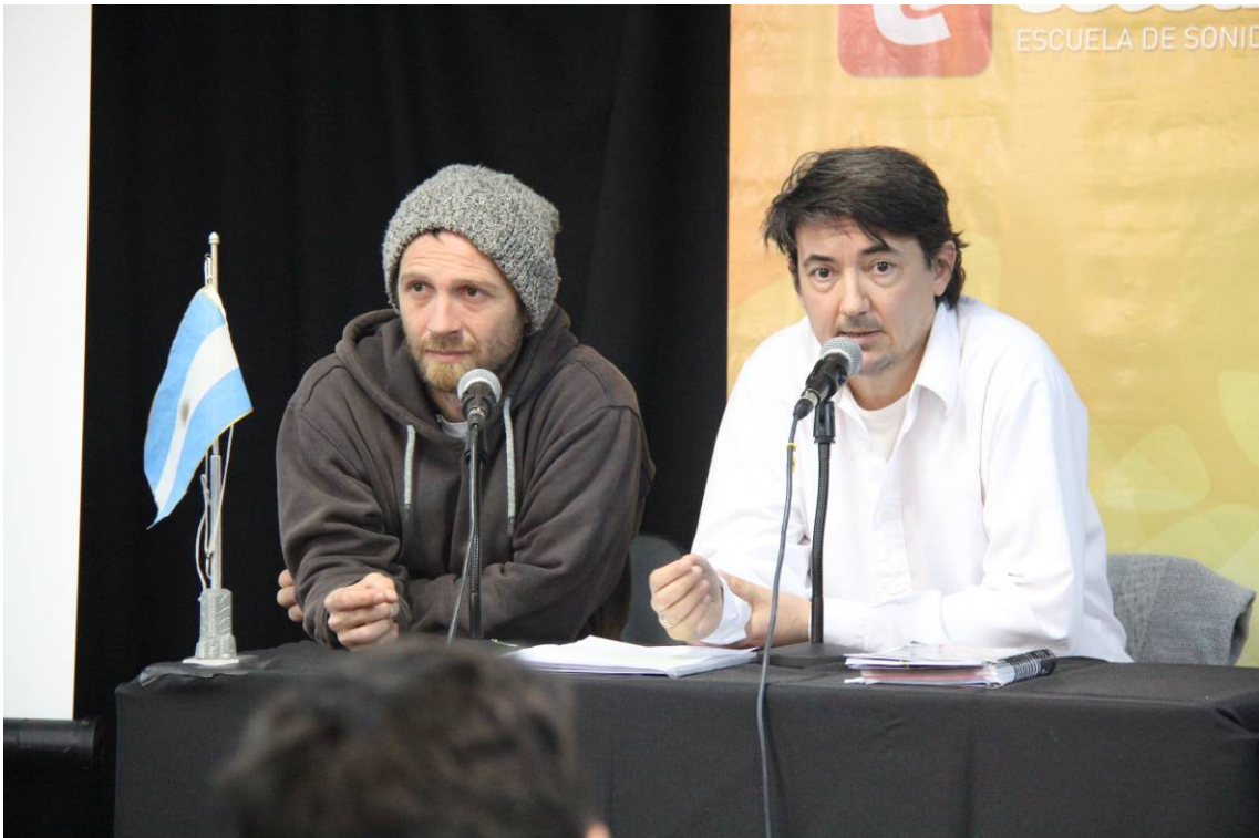
Representantes del gremio de los Técnicos Escénicos