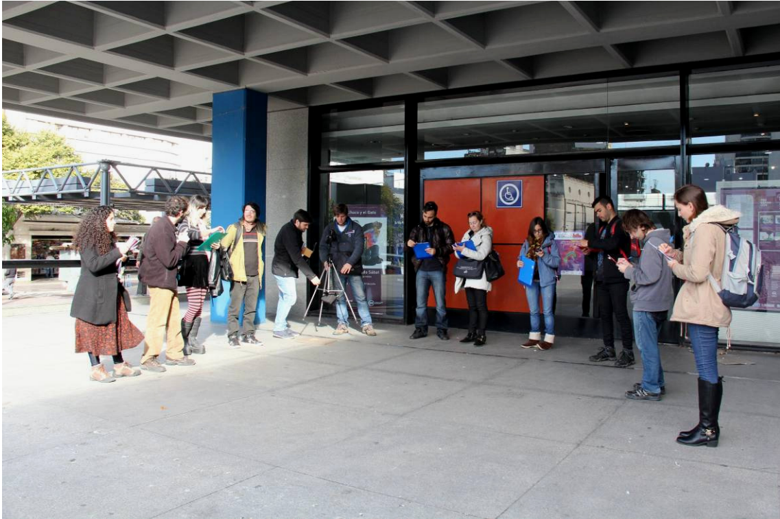
Comenzando la caminata sonora