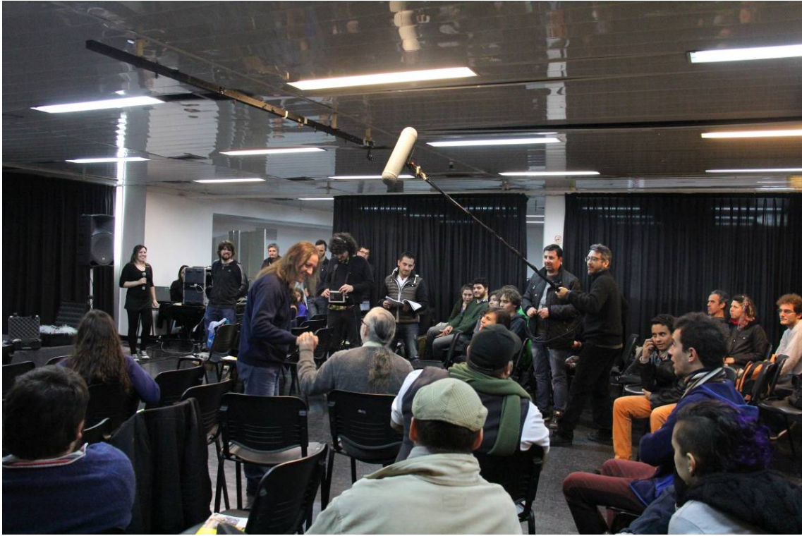
Taller de sonido directo en rodaje