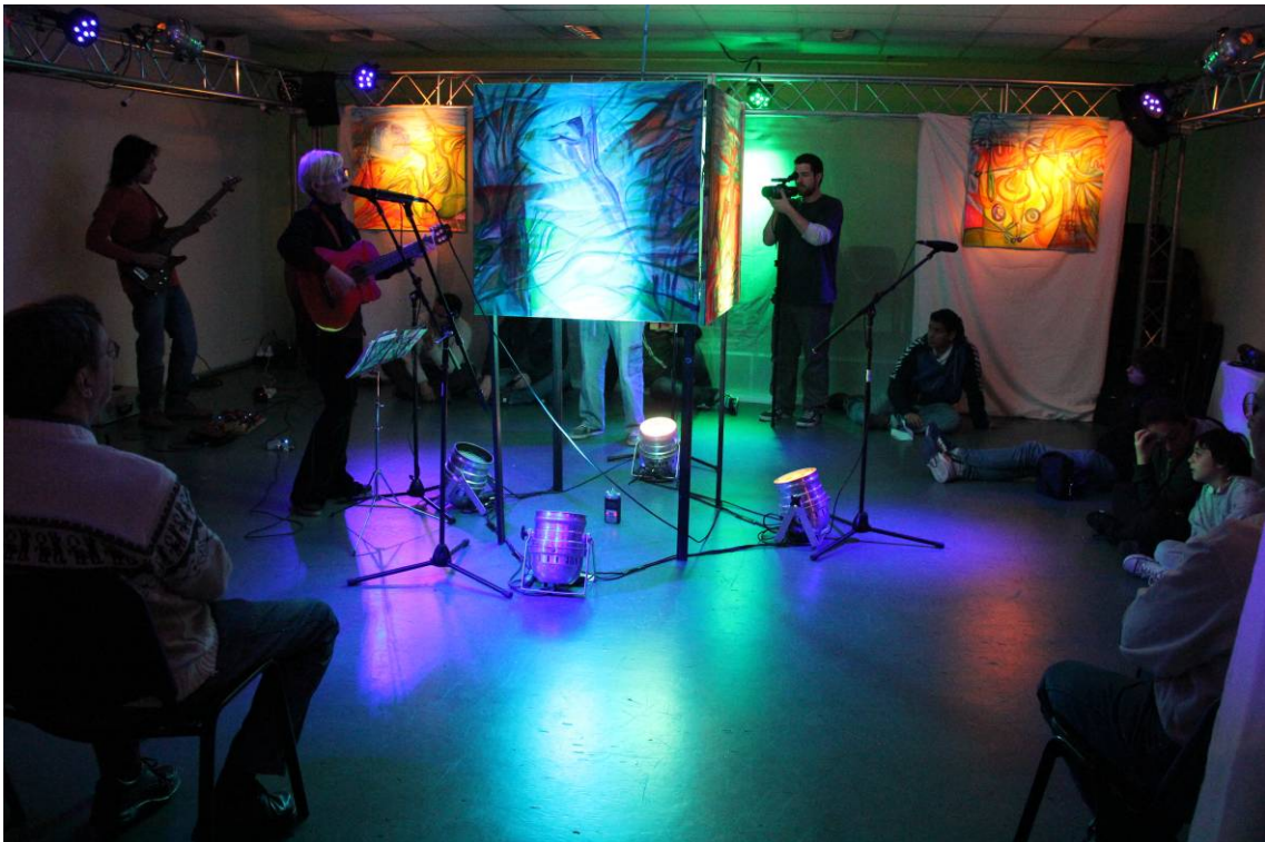
Intervención sobre ADN