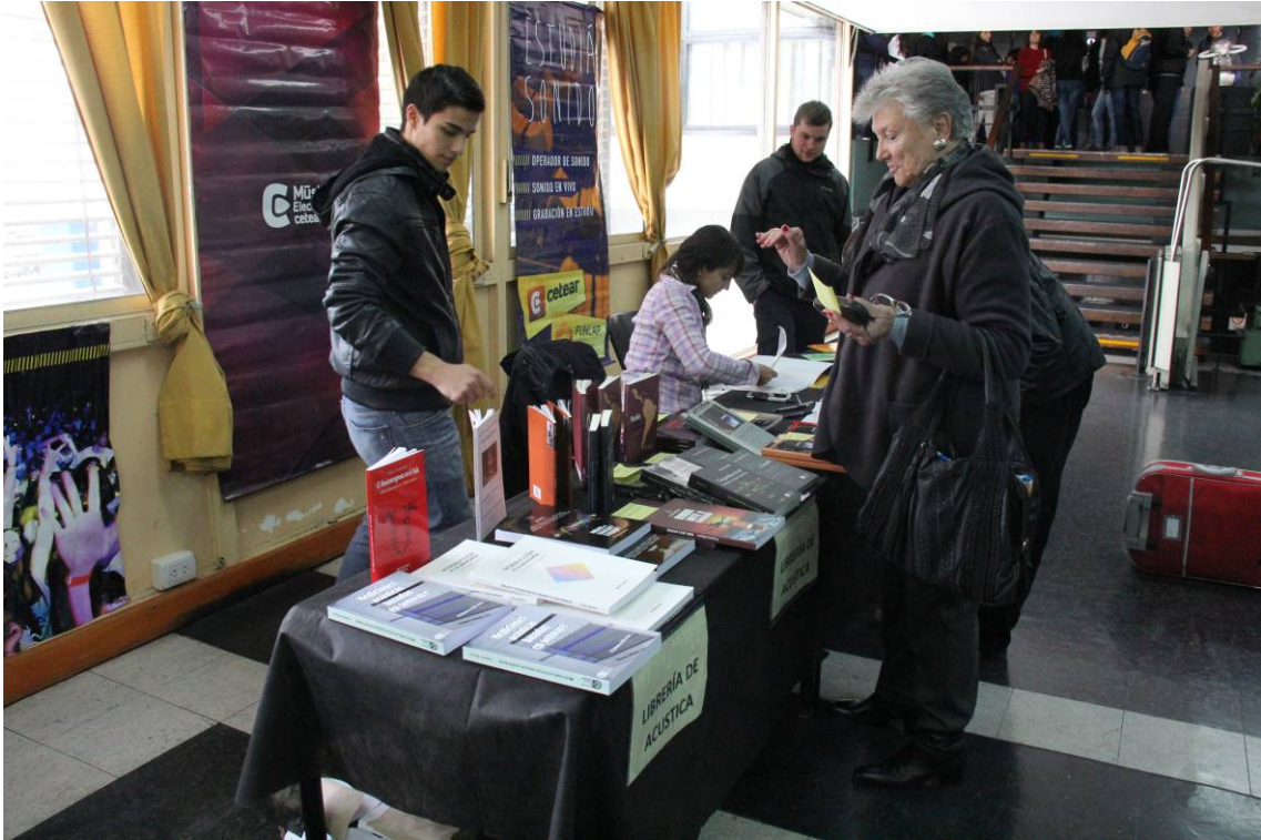
Feria del Libro de Acústica de Autores Argentinos (FLAdAA)