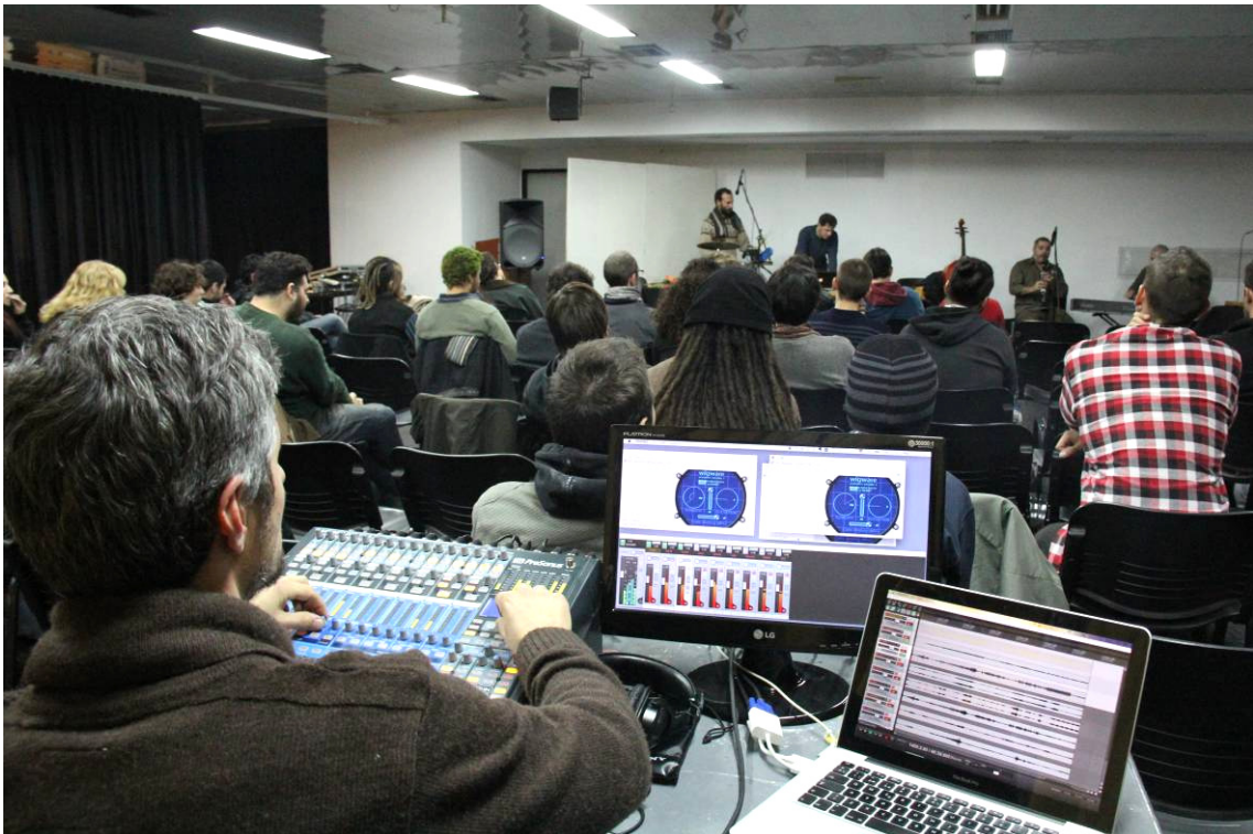
Taller de grabación desde la consola