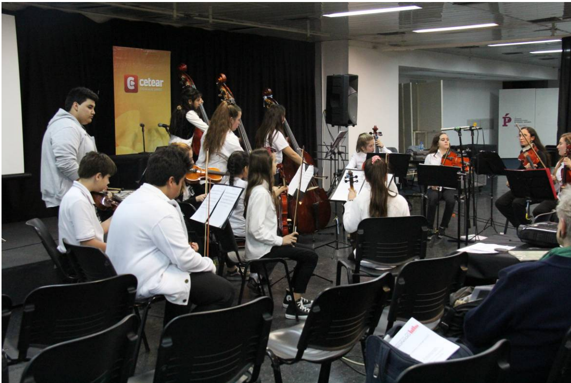
Orquesta Infanto Juvenil de Baigorria (cuerdas)