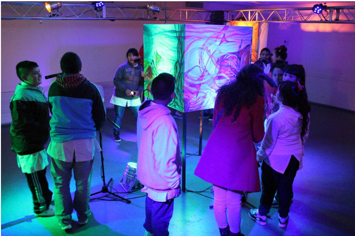
Visita escolar a la instalación multiartística ADN