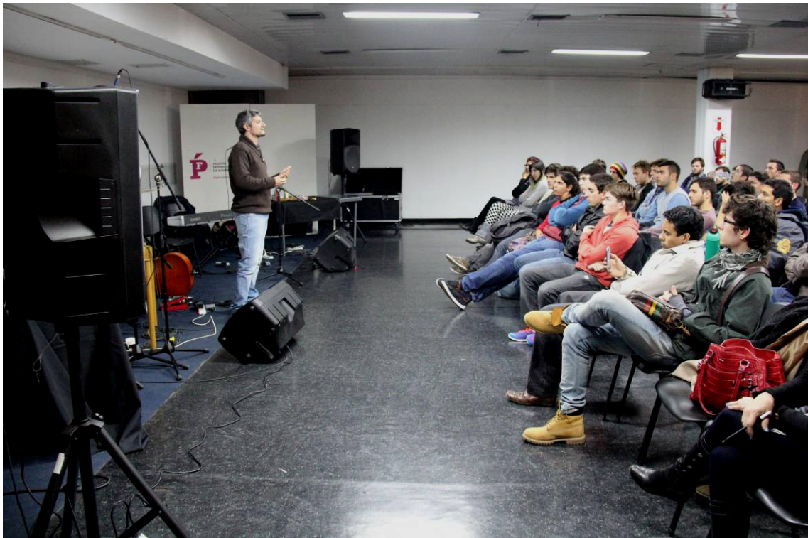
Taller de grabación