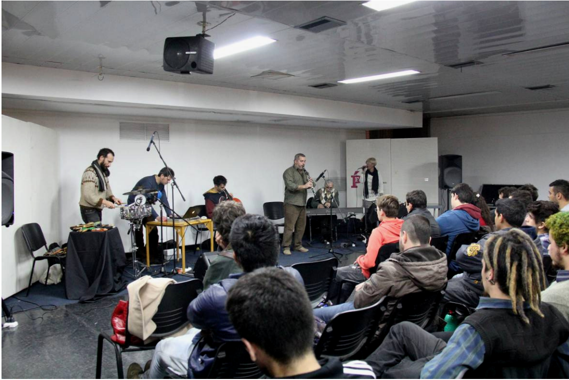
Improvisación libre en el Taller de grabación