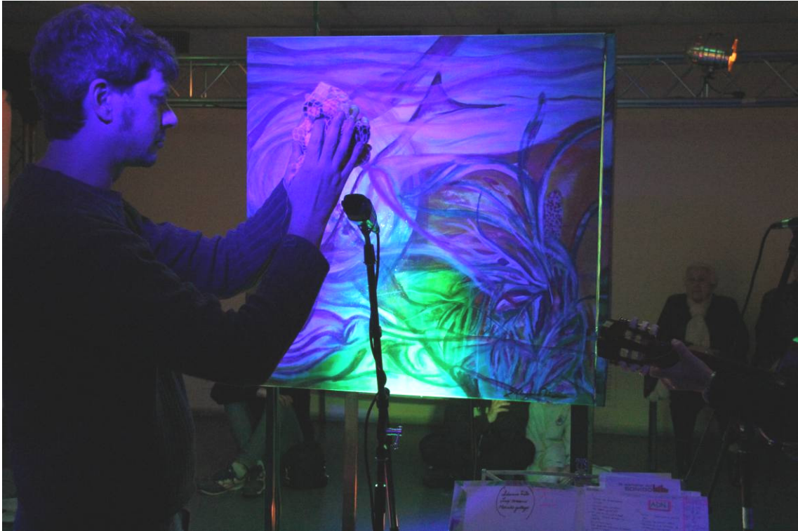
Intervención improvisatoria sobre ADN