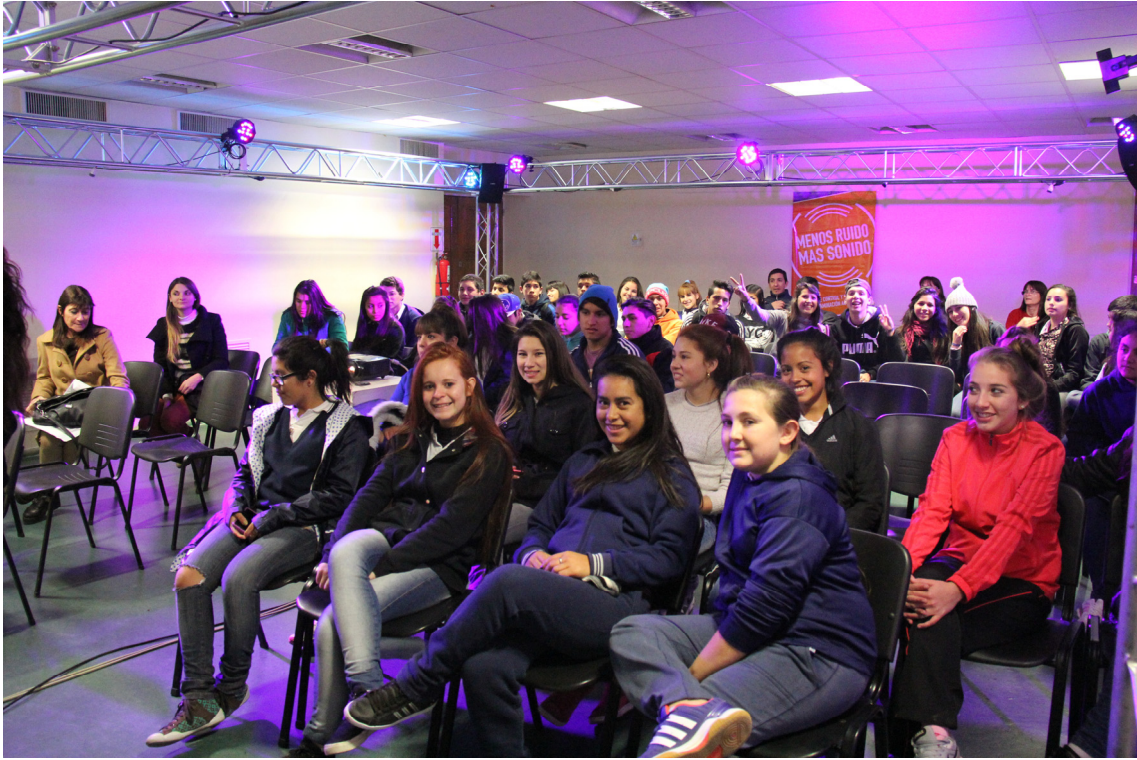
Taller Menos Ruido Más Sonido