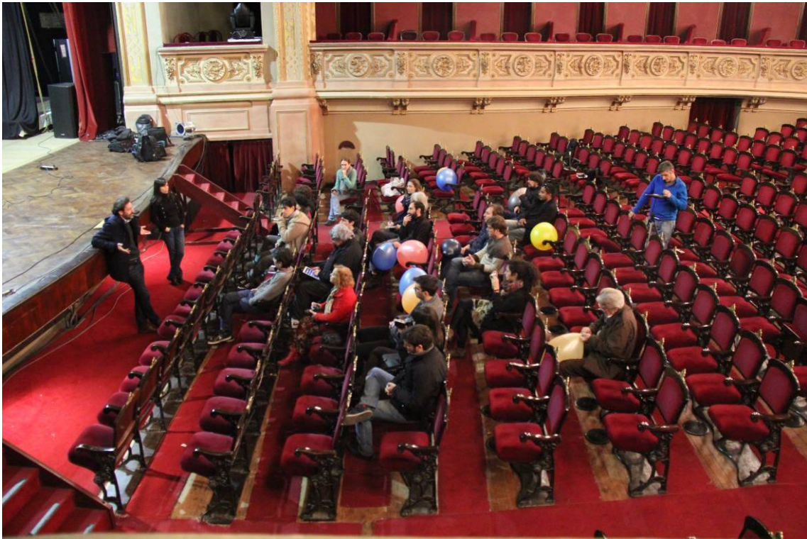
Mediciones acústicas en el Teatro El Círculo