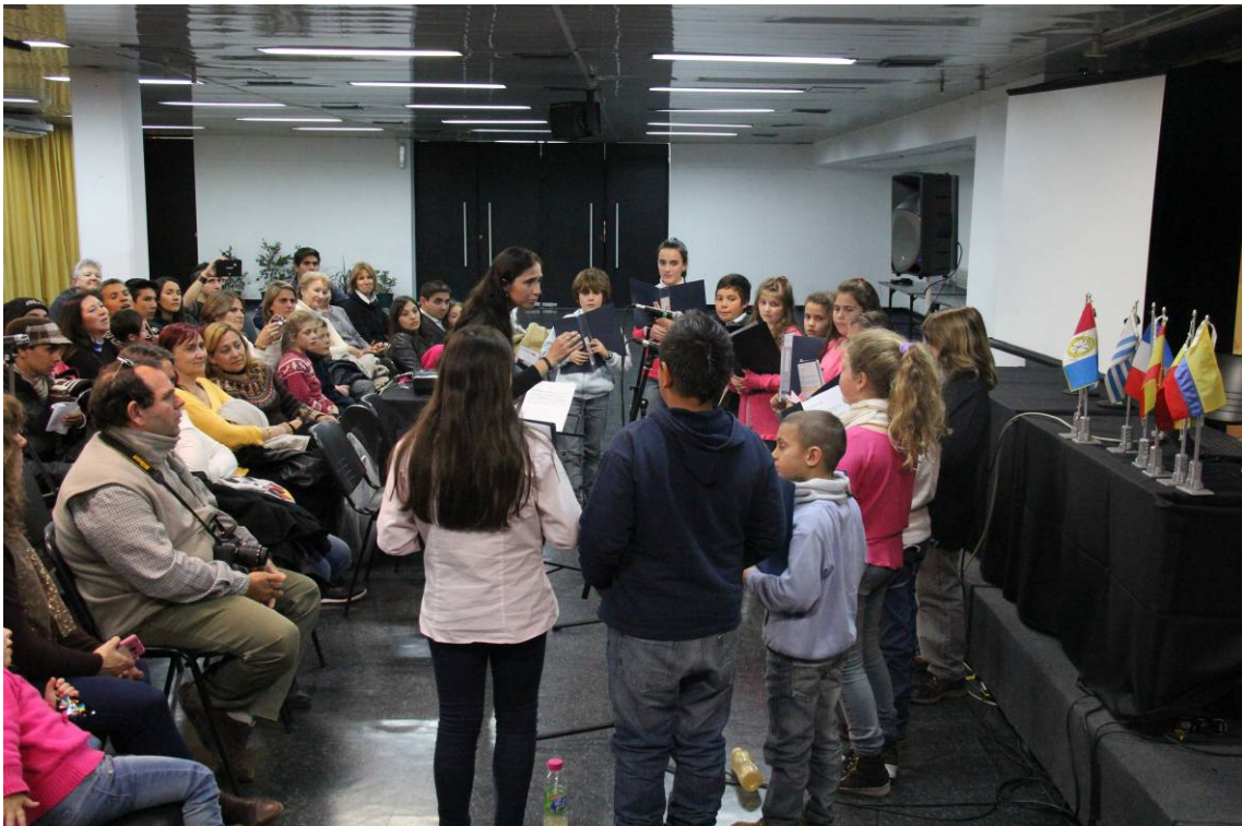
Coro de Niños de Funes