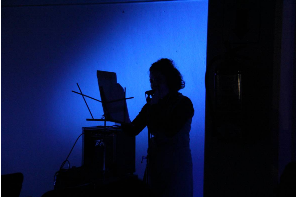
Concierto del CEMyT