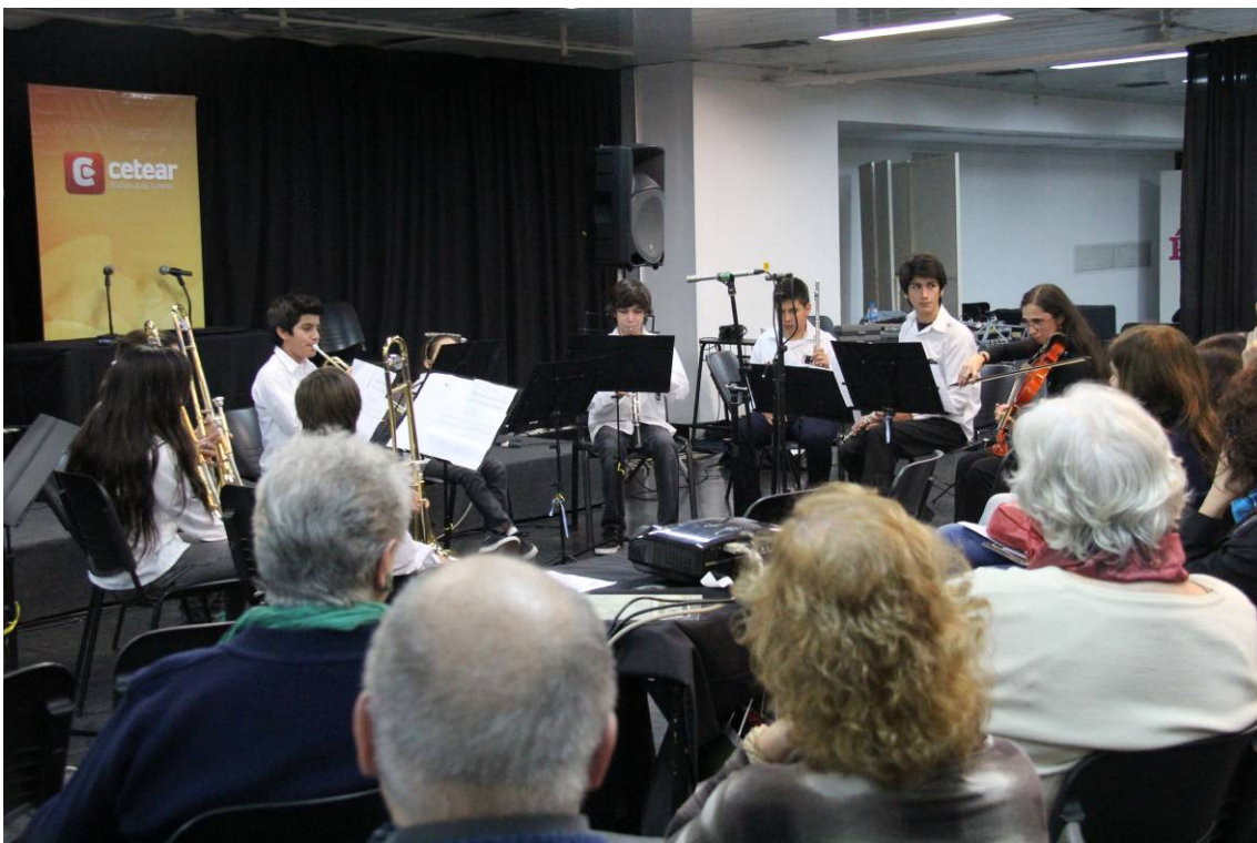
Orquesta Infanto Juvenil de Baigorria (vientos)