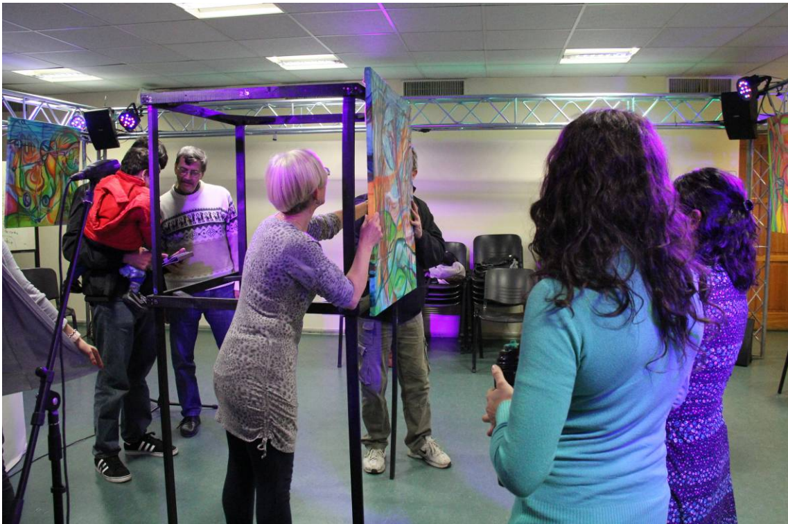
Preparando la instalación multiartística ADN