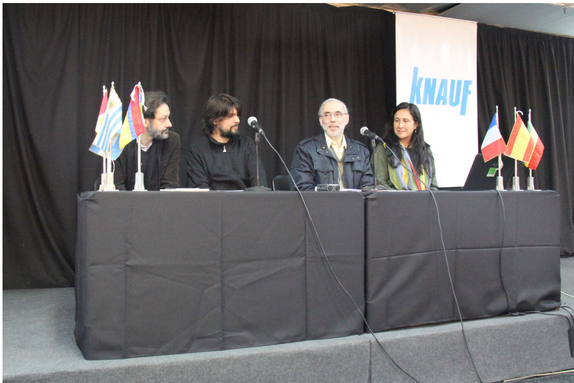
Inauguración de la Semana del Sonido Rosario 2015